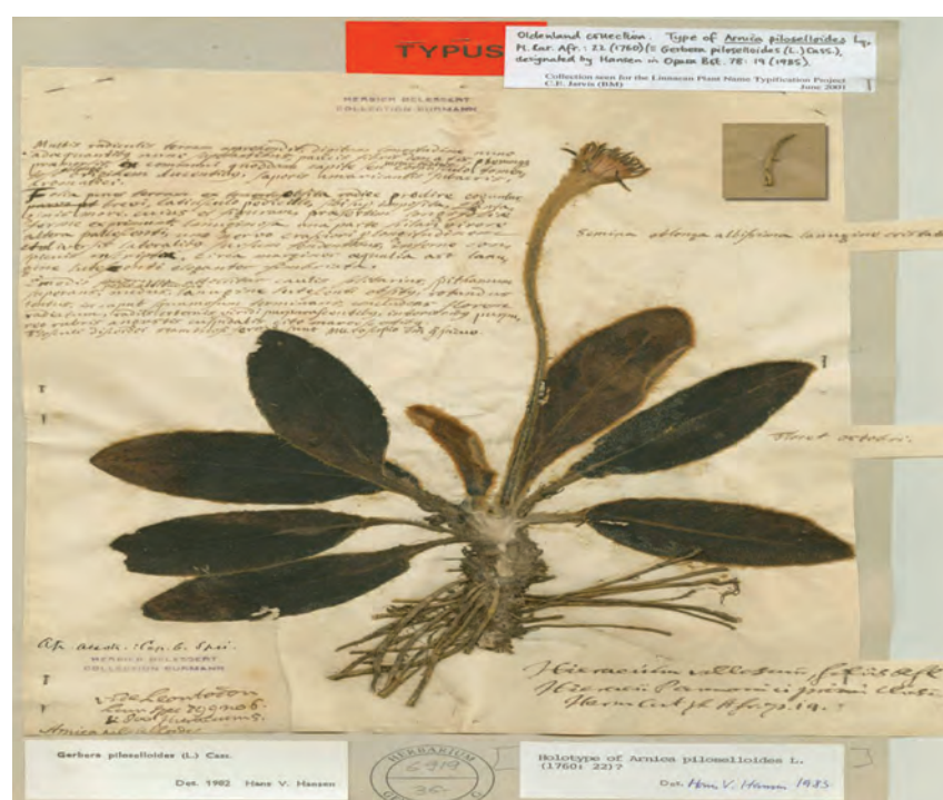
Gerbera piloselloides , composée décrite par Linné sur du matériel récolté par Oldenland au Cap de Bonne-Espérance vers 1690.

sont à ce titre très intéressants. Pensé comme une architecture de « stockage », l'ensemble du bâtiment se développe sur deux niveaux de référence : un sous-sol contenant dans de multiples salles protégées la collection et un rez-de-chaussée dédié aux activités administratives et de recherche avec la particularité d'un deuxième niveau contenant le prolongement de la bibliothèque. En regardant de plus près cette architecture, on comprend qu'elle ne cherche pas, par des attributs particuliers, à valoriser son contenant. Il ne s'agit pas ici de surjouer, à l'instar de toutes les architectures publiques du XIX e , l'effet du programme avec des espaces ou des volumes intérieurs significatifs de la fonction. L'herbier de Genève est sans nul doute un lieu générique et neutre permettant une grande adaptabilité et une grande flexibilité. La preuve s'exprime à nouveau par le paradoxe. En quarante ans, l'herbier et la bibliothèque du Jardin botanique, plutôt que de s'adapter ou de déménager, n'ont fait qu'accroître leur capital en augmentant le nombre d'échantillons et de documents classés et ainsi affirmer leur pérennité dans le temps.