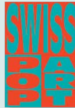
SWISS POP ART Scheidegger & Spiess / Aargauer Kunsthaus, Aarau