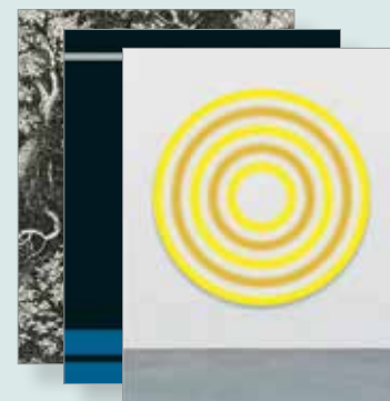
UGO RONDINONE - Kiss Now Kill Later, New Horizon, Pure Sunshine JRP/Ringier