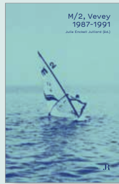
M/2, VEVEY 1987-1991