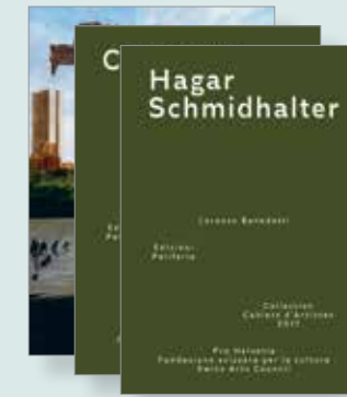
COLLECTION CAHIERS D'ARTISTES 2017, SÉRIE XIII Pro Helvetia & Edizioni Periferia

Claudio Moser est un photographe toujours pertinent et précis dont le regard s'attarde volontiers sur les espaces interstitiels et difficilement qualifiables situés en périphérie des villes, ou sur des constructions humaines. Invité à réaliser l'exposition de l'été 2017 sur le couronnement du barrage de Mauvoisin, il a choisi d'y installer vingt-huit photographies – sélectionnées parmi des images préexistantes et recadrées à la dimension des panneaux imposés – ainsi que deux miroirs qui lui permettent, dit-il, « d'intégrer le temps présent ». L'exposition trouve un écho au Musée de Bagnes au Châble avec, cette fois-ci, de nouveaux travaux en lien avec l'architecture et l'atmosphère du lieu. Ce catalogue documente l'événement. MD