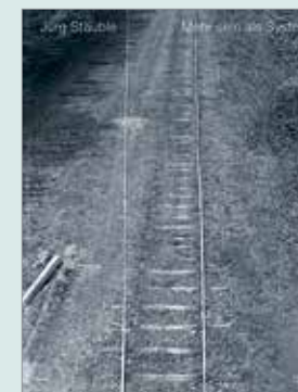
JÜRIG STÄUBLE Mehr sein als System Hatje Cantz

Trois volumes d'un coup, voilà qui ravira les fans de ce Suisse installé à New York, l'une des voix les plus fortes et significatives de la scène artistique contemporaine. Plasticien aux multiples facettes utilisant aussi bien la peinture, le dessin et la sculpture que l'installation ou la vidéo, Ugo Rondinone se plaît à tromper nos attentes, se jouant avec élégance de notre imaginaire et de nos références. Oscillant constamment entre figuration et abstraction, il pratique en maître l'art de la série et des variations sur un même thème. En témoignent ces trois ouvrages consacrés à trois de ses sujets favoris : les paysages, les horizons et les soleils. Chaque volume inclut en outre la lecture de spécialistes, dont Bice Curiger et Lionel Bovier. MD