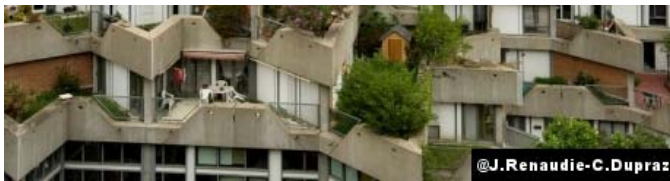
Ensemble de logements à Givors, Jean Renaudie